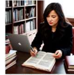
Figura creada con Leonardo.AI (2023)